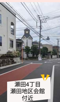
瀬田4丁目 瀬田地区会館 付近

瀬田交差点から用賀駅に向かう手前の246号線に繋がる脇道は、スピードを出した自転車や車の出入りが多く危険なため、飛び出し注意の看板が設置されました