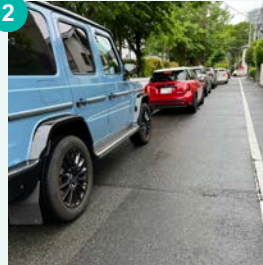
2 セントメリーズ付近

セントメリーズと法徳寺の間の道(赤い矢印)は、送迎の車が多く停車しています。スピードを出した車も多く走っていて危険です。