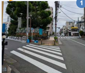
1 瀬田中学校交差点 陸橋(ローソン前)

陸橋工事のため、瀬田陸橋か、東急バス営業所付近の陸橋を渡るようになっていますが、横断歩道を渡っているお子さんがいます。陸橋を渡るよう今一度お子さんに伝えてください。