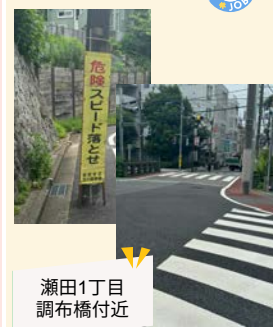
瀬田1丁目 調布橋付近

二子玉川駅に向かう急坂の「スピード落とせ」の看板が車から見えやすい向きに変更されました。あわせて、調布橋の交差点に歩行者信号が設置されました