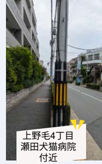
上野毛4丁目 瀬田犬猫病院 付近

環八からの抜け道としてスピードを出した車が多く危険なため、注意幕が設置されました