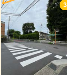
3 こひつじ幼稚園交差点

こひつじ幼稚園から先の公園に向かう交差点は、4方向から車が走ってきます。線路沿いの坂道からスピードを出した車も多く走ってきますので、飛び出しに注意し、左右を見て渡りましょう